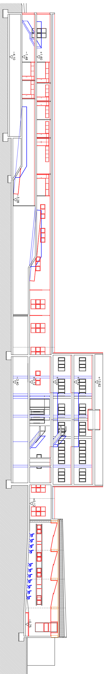
SECCION LONGITUDINAL GENERAL S2